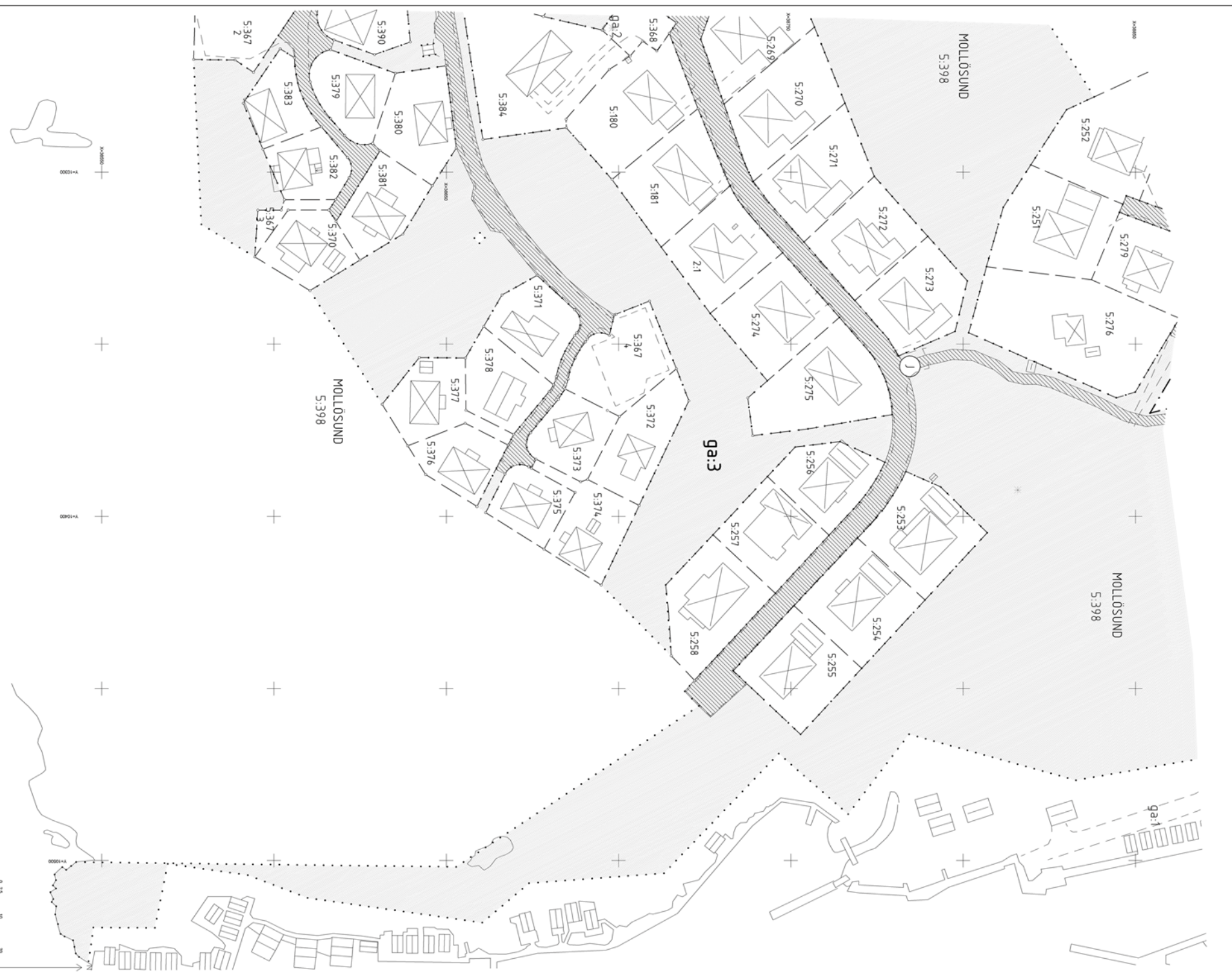
Aktbilaga KA8 Fastighetsrättslig beskrivning, se aktbilaga BE.

Karta 2009:06:05 Arkiv Arkivgrupp/inställning avseende vägar och allmänna Orter och byggnader i länskartan Orter och byggnader i länskartan Orter och byggnader i länskartan Orter och byggnader i länskartan