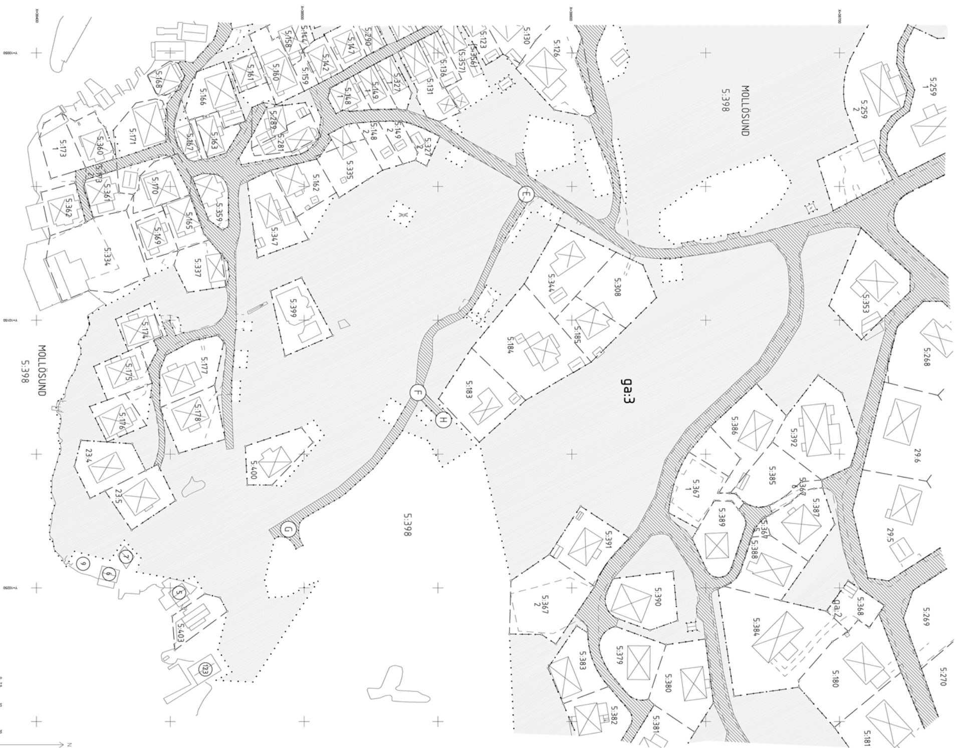
Aktbilaga KA7 Fastighetsrättslig beskrivning, se aktbilaga BE.

Karta 2009:06:05 Arkiv Arkivgrupp/inställning avseende vägar och allmänna Orter och byggnader i länskartan Orter och byggnader i länskartan Orter och byggnader i länskartan Orter och byggnader i länskartan